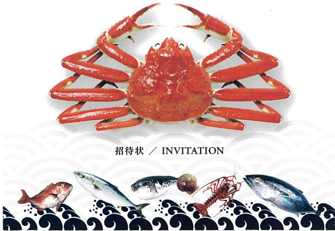
招待状 / INVITATION

The 24th Japan International Seafood & Technology Expo